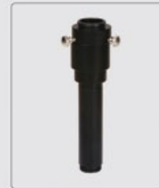
interfaccia fotocamera (opzionale)